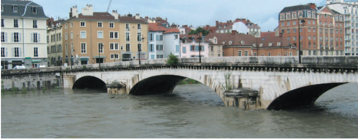
L'Isère à Grenoble (pont Marius-Gontard) le 30 mai 2008