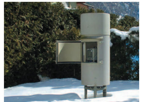
Pluviomètre EDF au Bourg-d'Oisans

Le réseau du SPC Alpes du Nord comporte une vingtaine de stations hydrométriques (mesures de niveau en rivière collectées en temps réel). Le SPC ne dispose pas de moyens propres pour estimer les débits. Il s'appuie alors sur des partenariats avec la DREAL Rhône-Alpes, EDF et la CNR. Selon les accords de partenariat, ces données peuvent être diffusées sur les sites Internet http://www.rdbmrc.com/hydroreel2/ et Vigicrues.