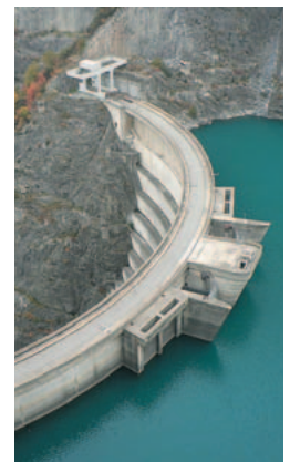
Barrage EDF de Monteynard

Les pentes fortes des versants montagneux entraînent des vitesses d'écoulement de l'eau importantes et génèrent une érosion très active des terrains. Le caractère torrentiel des têtes de bassin versant, marqué par un transport solide conséquent (blocs de pierre, graviers, boues), est peu propice à l'installation de stations de mesure en rivière et rend donc très délicat leur surveillance.