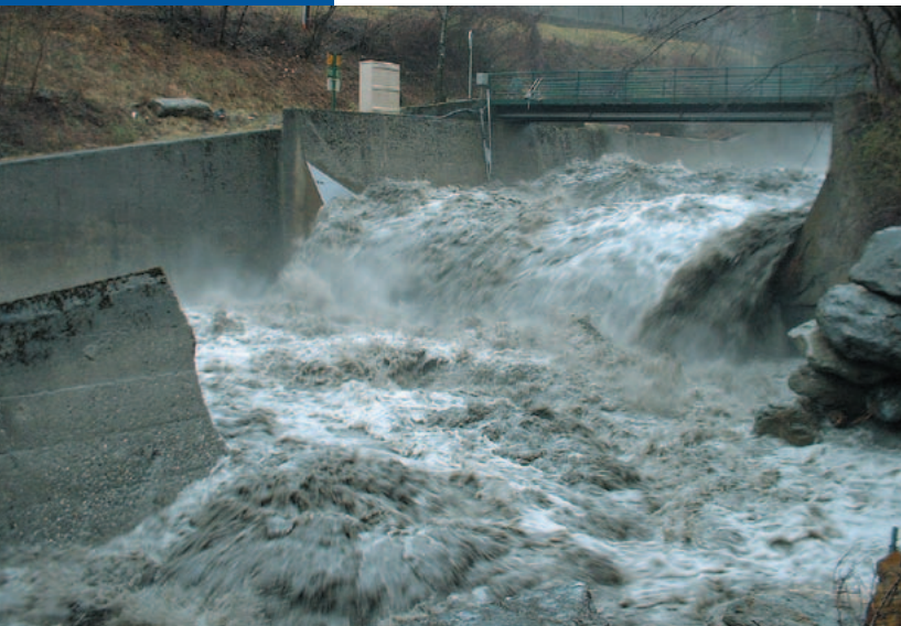
L'Arly à Ugine (Moulin Ravier) le 5 janvier 2004

Toutes ces spécificités rendent délicates la surveillance et la prévision des crues sur le territoire du SPC Alpes du Nord.